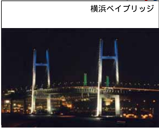
横浜ベイブリッジ