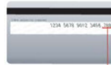
セキュリティコード