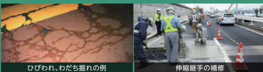
ひびわれ、わだち掘れの例

お客さまが安心・安全に首都高を走行いただけるよう、劣化した舗装および高架間の路面継ぎ目(伸縮継手)の補修を行っています。路面の補修により、路面の連続性・平坦性を保ち、走行時の騒音・振動を防止します。