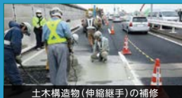
土木構造物(伸縮継手)の補修