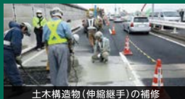
土木構造物(伸縮継手)の補修