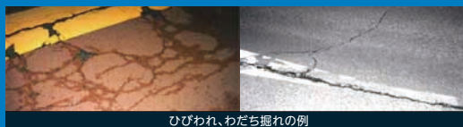
ひびわれ、わだち掘れの例

お客さまに快適に走行いただけるよう、日常的な巡回点検、定期的な詳細点検により舗装路面状況を適切に把握し、劣化箇所を補修しています。