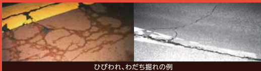
ひびわれ、わだち掘れの例

お客さまに快適に走行いただけるよう、日常的な巡回点検、定期的な詳細点検により舗装路面状況を適切に把握し、劣化箇所を補修しています。