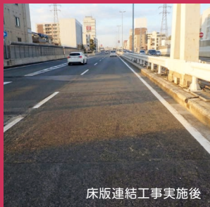
床版連結工事実施後

お客さまに首都高をより安全で快適にご利用頂けるよう、 5 池袋線高島平付近で床版連結工事を実施いたします。