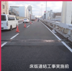
床版連結工事実施前

お客さまに快適に走行いただけるよう、橋の継ぎ目を温度変化による伸び縮みに合わせて繋ぐ工事です。