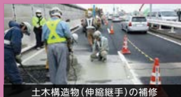
土構造物(伸縮継手)の補修