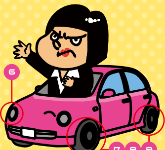
クルマの周り 4項目