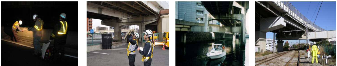
高速上・高架下からの目視による点検