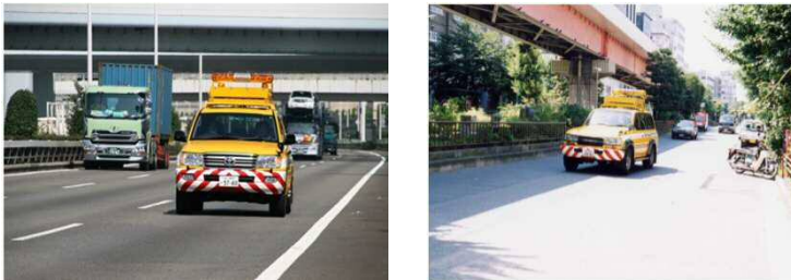
高速上・高架下からのパトロールカーでの車上目視・感覚による点検