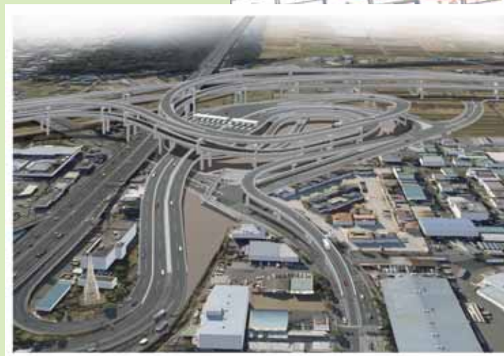
視点からのイメージ