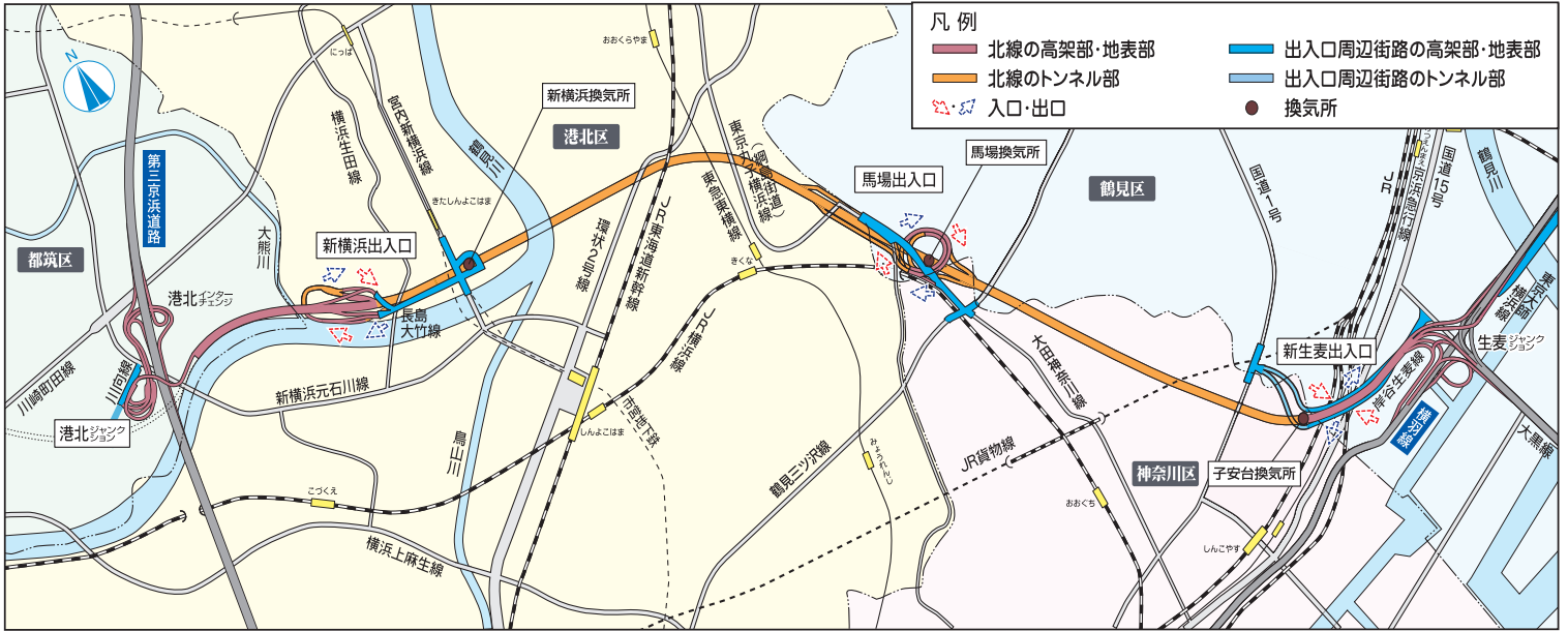
港北ジャンクション、各出入口及び各換気所の名称は仮称です。