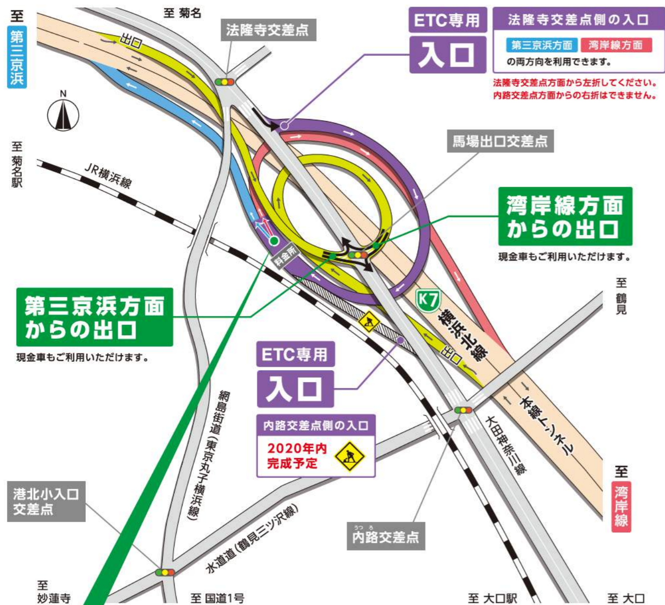
馬場入口拡大図 (料金所付近) ※2020.2.27 開通時点の形態