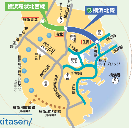
北西線・北線位置図