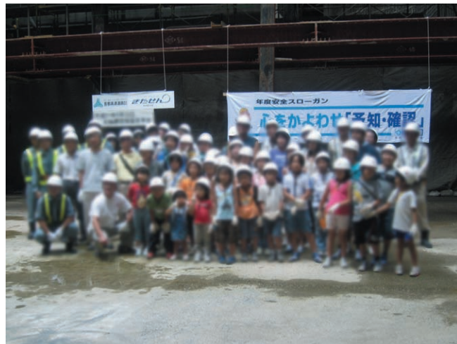
発進立坑の底で記念撮影

8月24日(月)に新羽小学校生などの参加による現場見学会を開催しました。発進立坑の底まで降りて記念撮影後、鉄筋の結束作業体験をしたり、バックホウという建設機械の運転台に乗って記念撮影したりしました。皆さん、暑い中、お疲れ様でした。