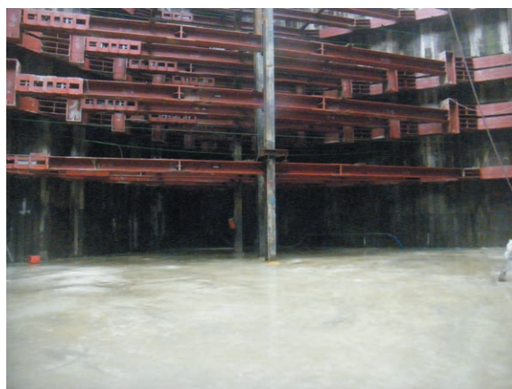
新横浜大橋側を眺む