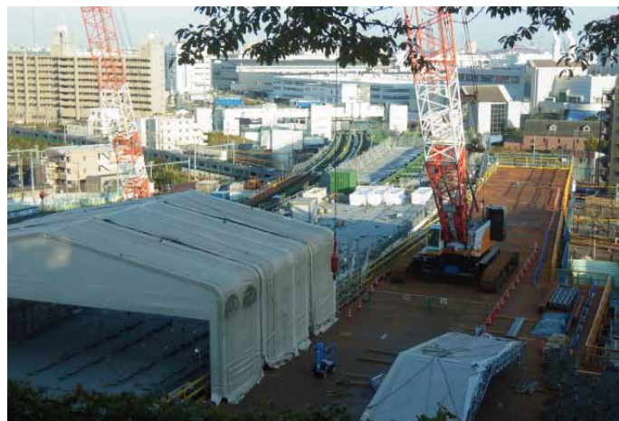
④ 鉄道交差部の桁地組状況(子安台公園から眺む)