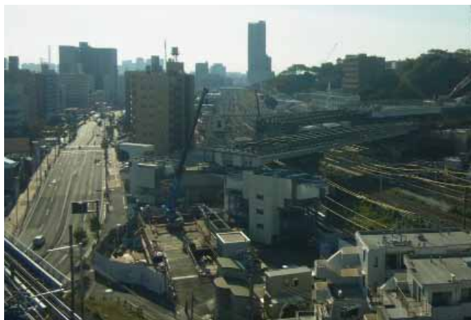
③ 鉄道交差部(国道15号側から眺む)