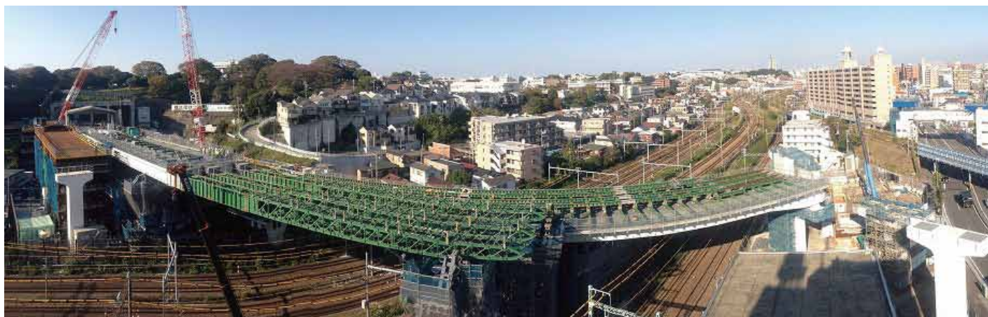
① 鉄道交差部(国道15号沿いから眺む)