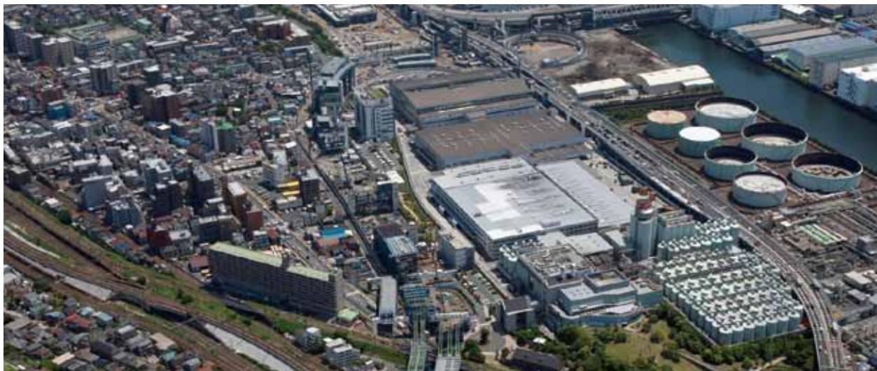
工事ヤード全体図(航空写真)