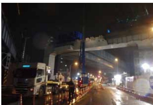
② 吊り足場設置状況