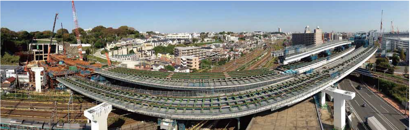
① 鉄道交差部(国道15号沿いから眺む)