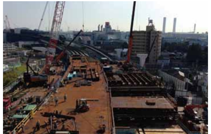
③ 鉄道交差部の桁地組状況(子安台公園から眺む)