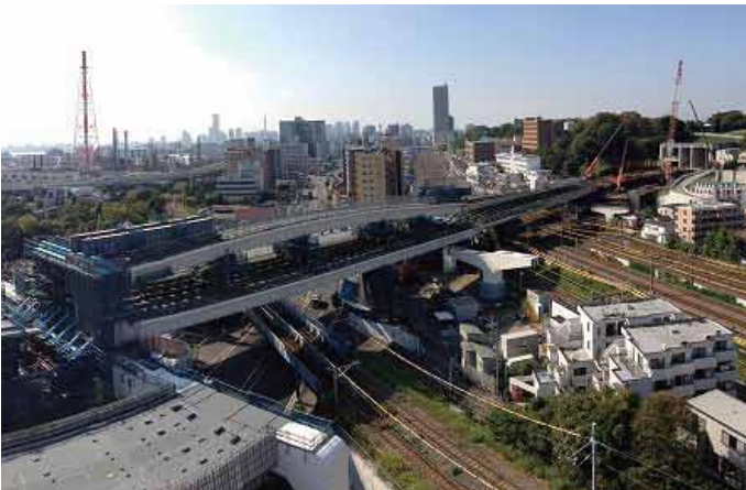
② 鉄道交差部(国道15号側から眺む)