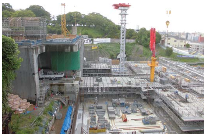
③ 子安台換気所部の躯体構築状況(子安台公園から眺む)