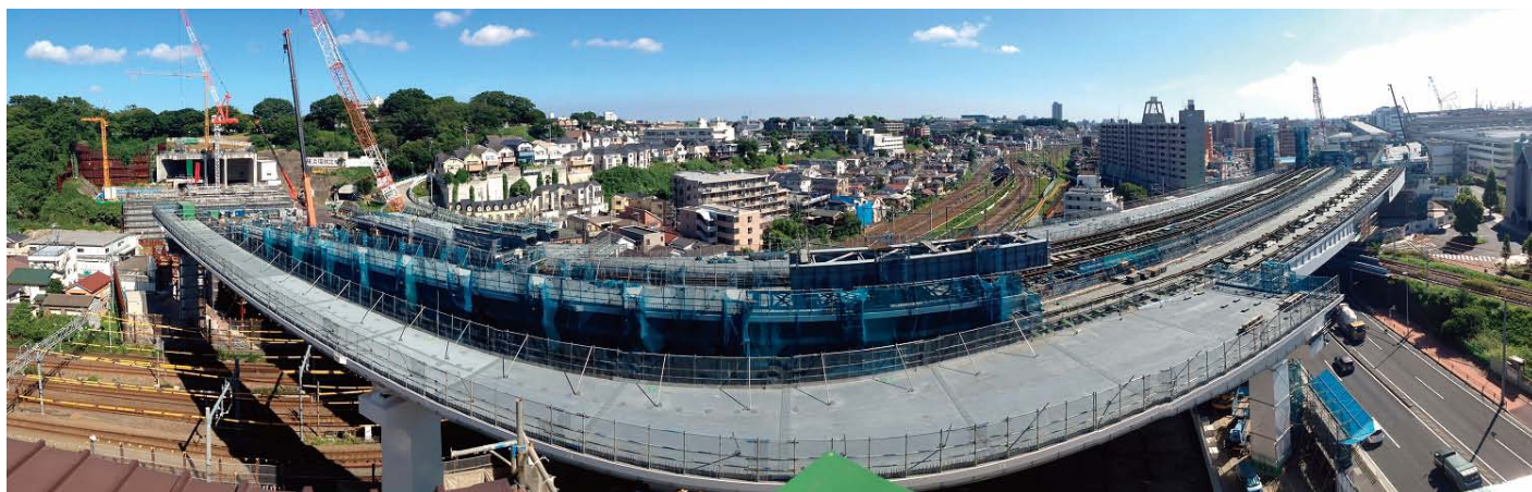
① 鉄道交差点部(国道15号沿いから眺む)