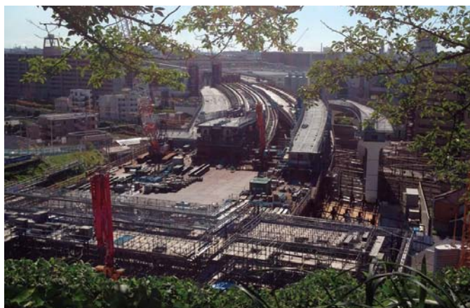
② 鉄道交差点部の構台上状況(子安台公園から眺む)