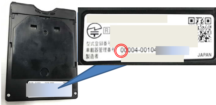
(写真): 旧セキュリティ対応車載器