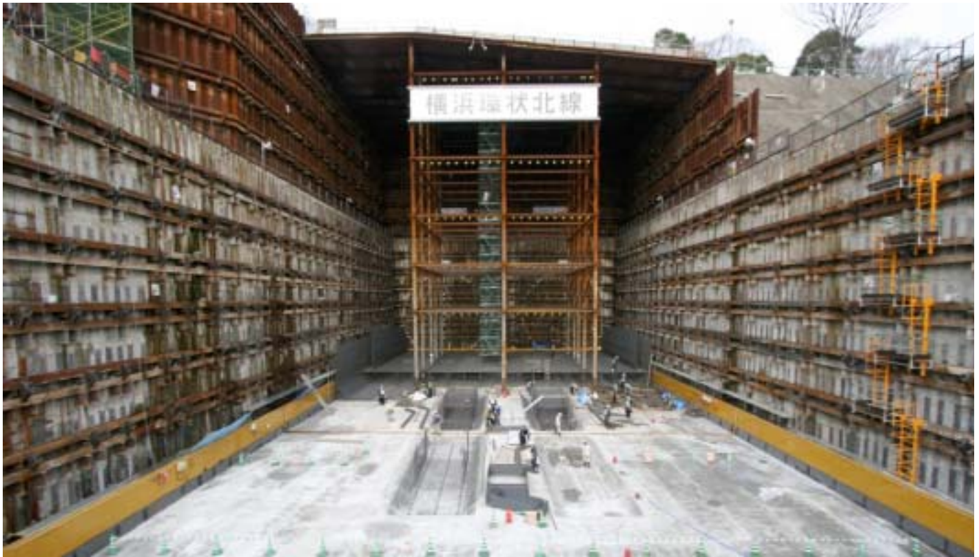
トンネル部躯体構築状況（正面の白丸印にシールドトンネルが接続します。）