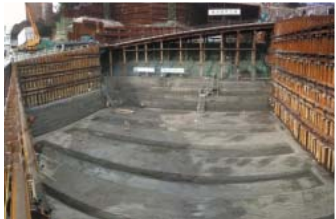
受変電棟部掘削完了状況