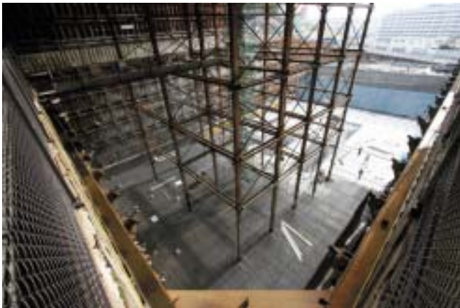
トンネル部鉄筋組立状況